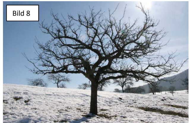
Fachgerechter Altbahmschnitt: gleichmäßige, moderate Kronenauslichtung (Bild 7,8)