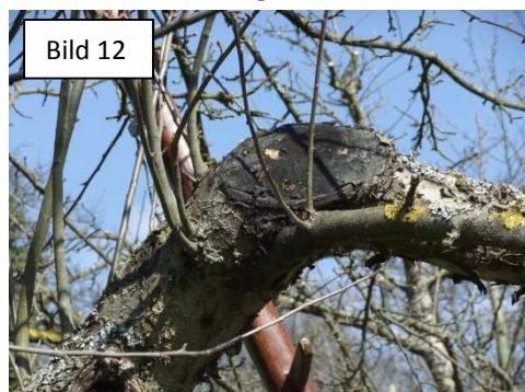
große Wunde astoberseits (Bild 12)

Leitast entfernt und Rindenriß (Bild 10) „Wasserreiser“ (Bild 11)